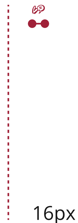
Taille minimale du logo